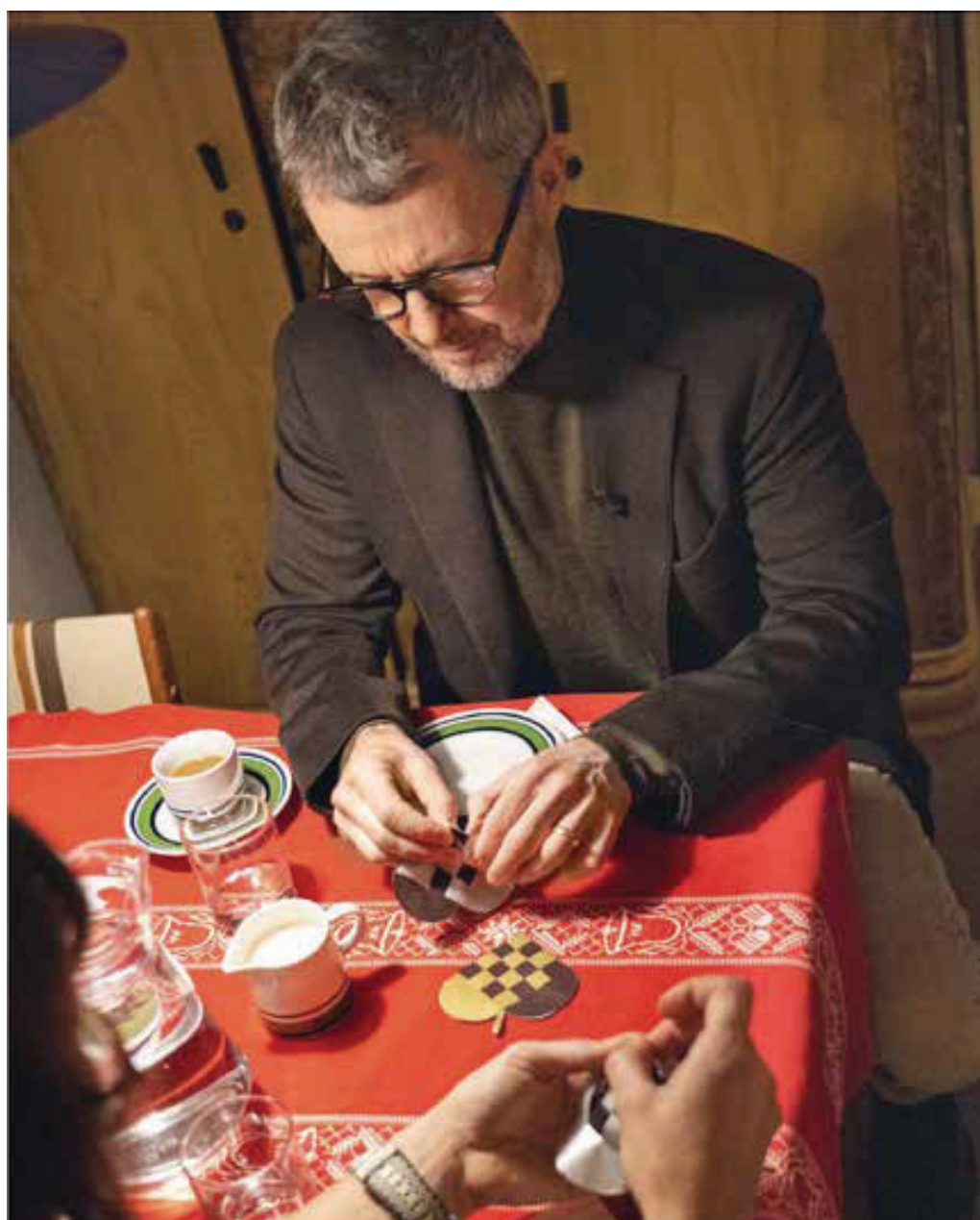
Kong Frederik flettede et julehjerte og hjalp med at pynte træet i arbejderparrets hyggelige lejlighed i 1974-kvarteret, da han i julen 2024 var på besøg.

Med "Strategi 2030" er retningen sat. Den Gamle By skal være et fælles hjem til tiden – og flere skal finde hjem i historien.